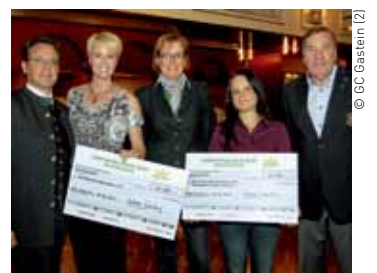
Golfen für den guten Zweck.